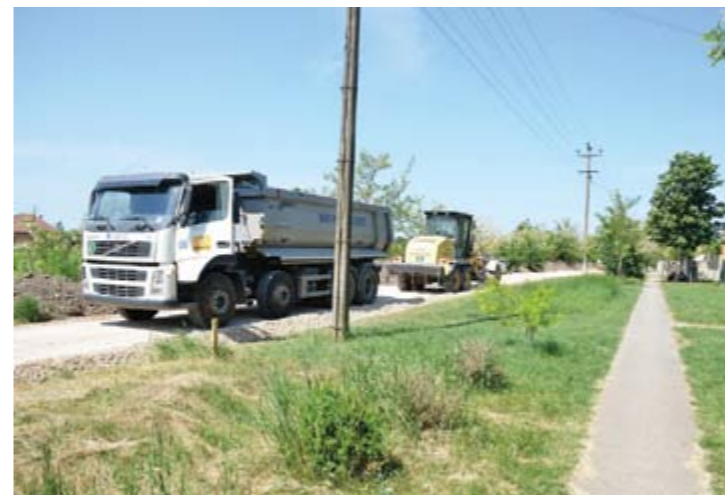
Улица „Братства јединства“ у Банатском Аранђелову

На челу са Српском напредном страном, руководство Општине се претходне две године бавило решавањем животних проблема, враћањем дугова, изградњом путне инфраструктуре, санацијом школа и другим примарним проблемима. Због недостака новца није било много културних збивања. А следеће године ће много више средстава бити утрошено за организовање концерата и других манифестација.