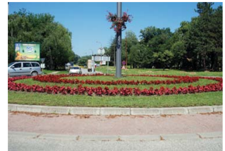
Уређен кружни ток