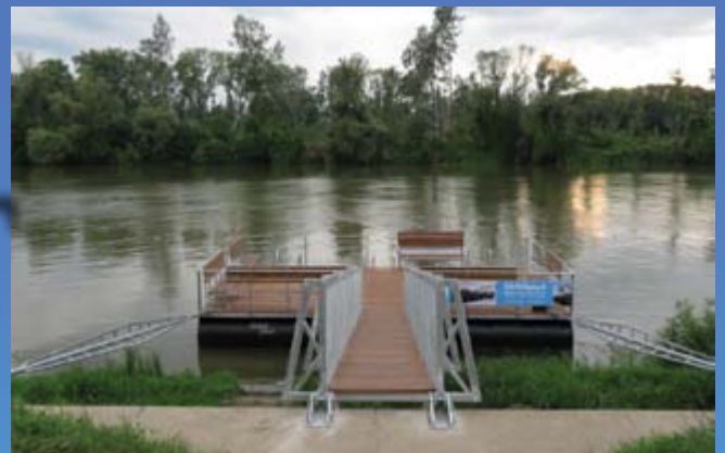
Нови понтон на Тиси