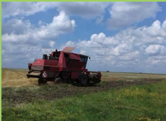
Скидање усева са узурпираног пољопривредног земљишта у државној освојини

Поштујући налог председника Општине, овај Програм је шанса за мала пољопривредна газдин-ства да већ од ове јесени, потпуно легално, заку-пом увећају свој посед парцелама до 5 хектара, али и онима од 5 до 20 хектара, што до сада нису били у прилици.