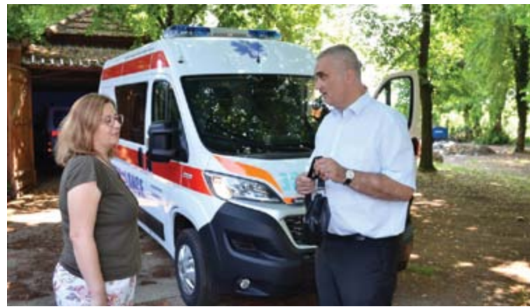
Ново санитарско возило у Дому здравља