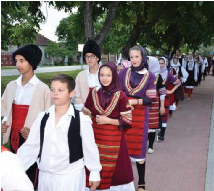
Фестивал фолклора „Ајд поведи, ајд заиграј“ у Српском Крстуру