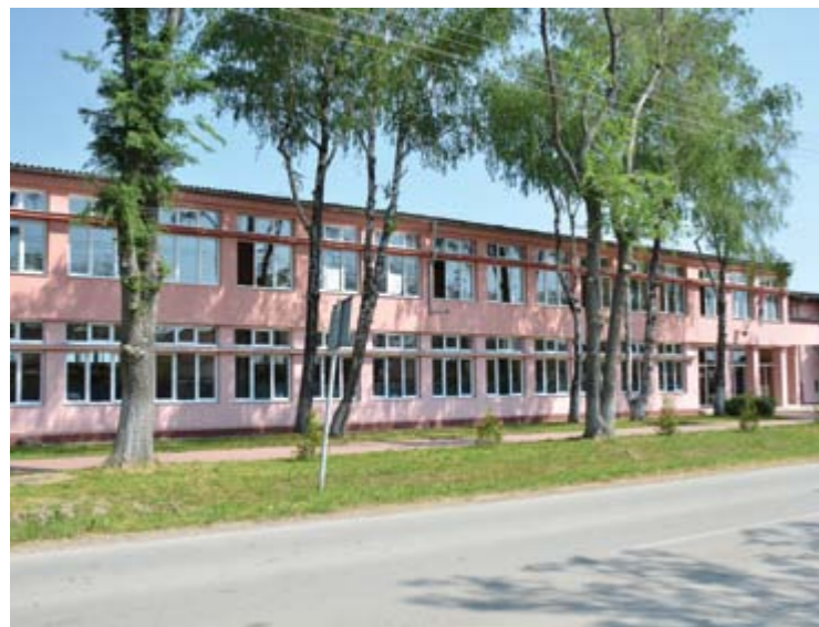
Школа у Српском Крстур