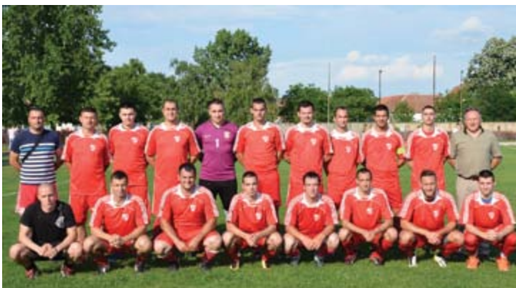
Обилић у врху лиге