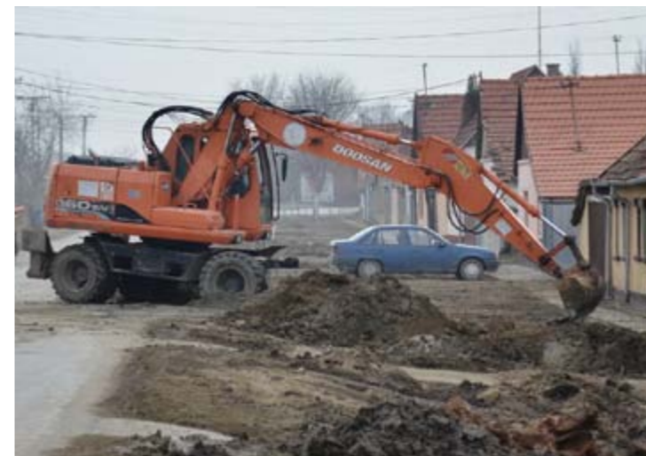
Настављени радови на изградњи канализације