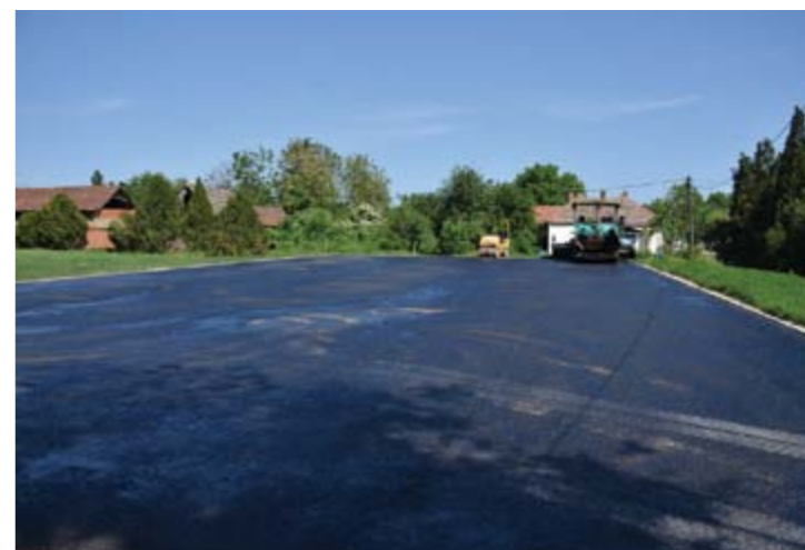
Спортски терени на Смиљевачи