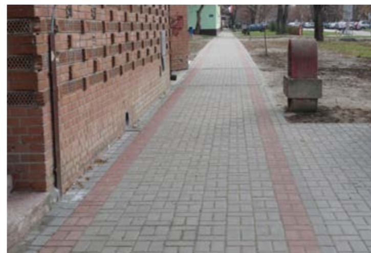
Тротоари у Новом Кнежевцу