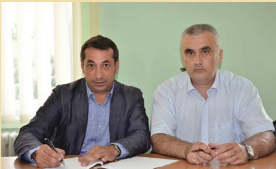
Нова радна места - потписан уговор са инвеститором