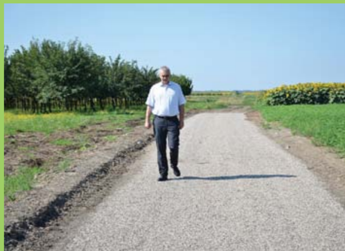
Уређење атарских путева