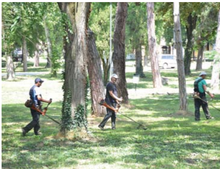
Парк у Новом Кнежевцу