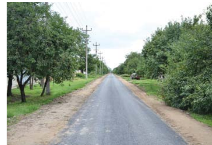
Улица Краља Петра Првог Карађорђевића у Српском Крстур